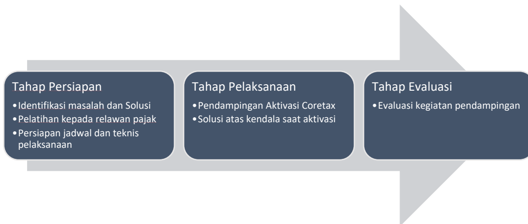
Gambar 2. Alur Metode Pelaksanaan Kegiatan Pengabdian

mengukur ketercapaian indikator keberhasilan, yakni berupa kuesioner kepada Wajib Pajak terkait pelaksanaan pendampingan aktivasi coretax.