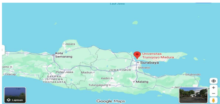
Gambar 1. Peta lokasi Universitas Trunodjoyo Madura, Kabupaten Bangkalan

Kegiatan pengabdian pendampingan aktivasi akun coretax dilaksanakan di Universitas Trunodjoyo Madura pada tanggal 14, 15 dan 17 Oktober 2025, bertempat di Gedung Labsos ruang Lab Komputer Universitas Trunodjoyo Madura. Universitas Trunodjoyo Madura adalah sebuah Perguruan Tinggi Negeri yang terletak di Jalan Raya Telang, Kamal, Bangkalan, Jawa Timur di Pulau Madura, Indonesia.