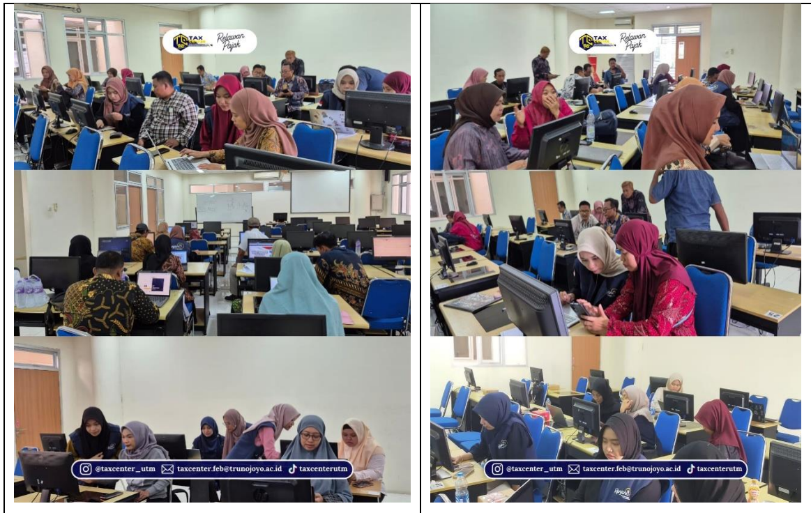
Gambar 4. Pelaksanaan Pendampingan Aktivasi Akun Coretax di Lingkungan Universitas Trunodjoyo Madura

juga akan meningkatkan akurasi data dengan sistem pembayaran yang terintegrasi. Diharapkan Wajib Pajak dapat mendukung reformasi administrasi perpajakan ini melalui sistem coretax, guna meningkatkan literasi pajak yang berujung pada kepatuhan pajak.