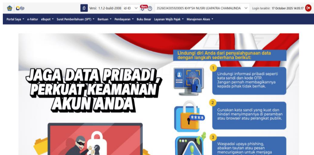
Gambar 6. Tampilan Sistem Coretax saat Wajib Pajak telah berhasil Aktivasi Akun

Tahap terakhir kegiatan ini yakni evaluasi. Evaluasi kegiatan ini melalui hasil survei yang ditemukan dilapangan terkait kendala yang dihadapi selama pelaksanaan kegiatan dan strategi efektif yang dilakukan, secara detail disajikan pada tabel 2 berikut: